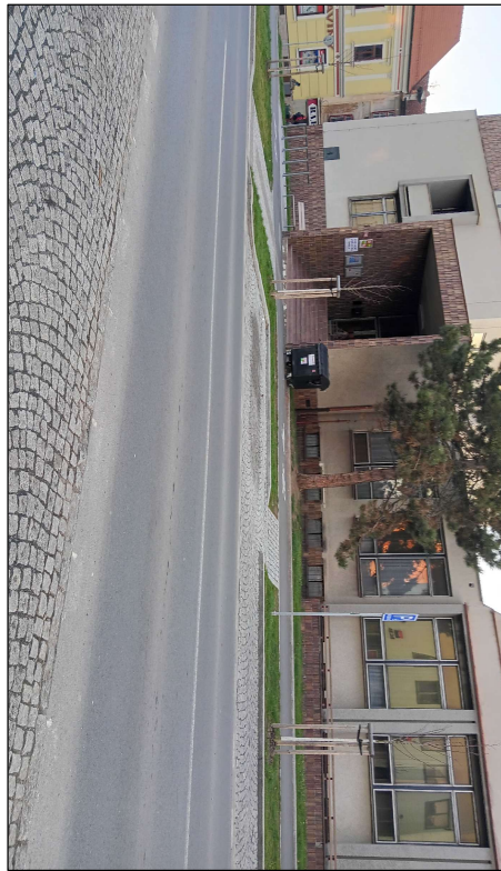
PŘÍSTUP DO BUDOVY A