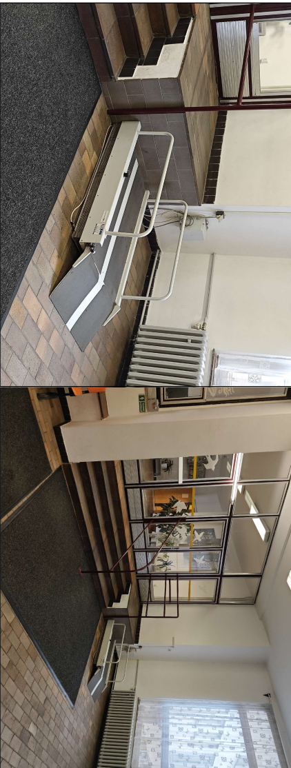
VÝTĚH A SCHODIŠTĚ