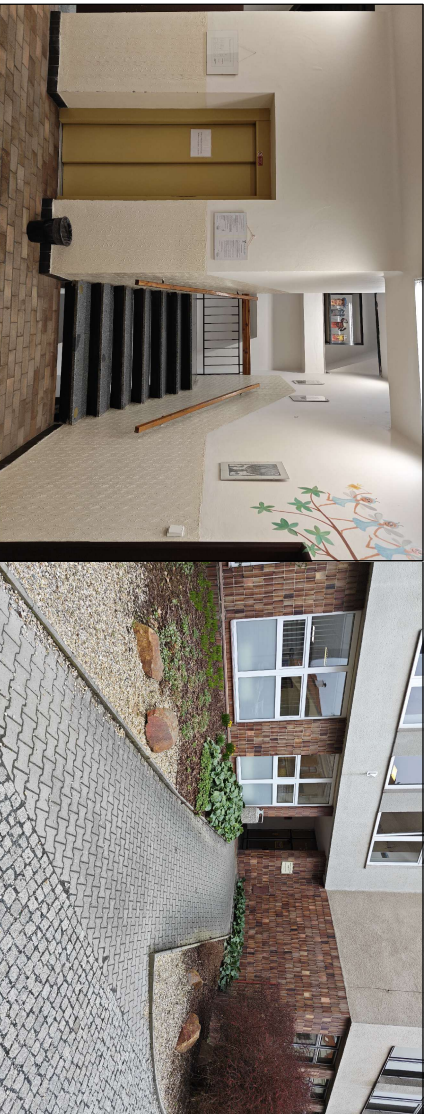
PŘÍSTUP DO PPP – BUDOVA C